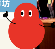
美好的時光 話劇培訓工作坊