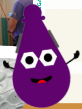
一級運動攀登證書課程