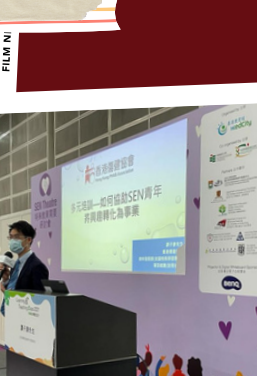
「學與教」博覽 特殊教育需要研討會分享