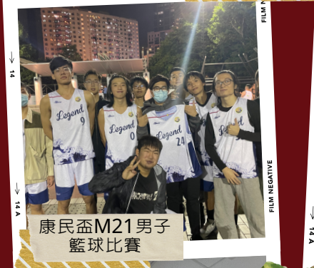
康民盃M21男子 籃球比賽