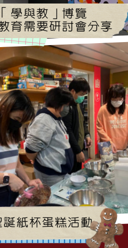
聖誕紙杯蛋糕活動