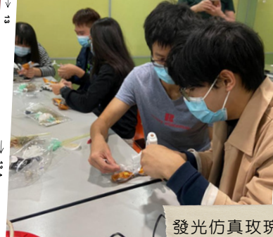
發光仿真玫瑰工作坊